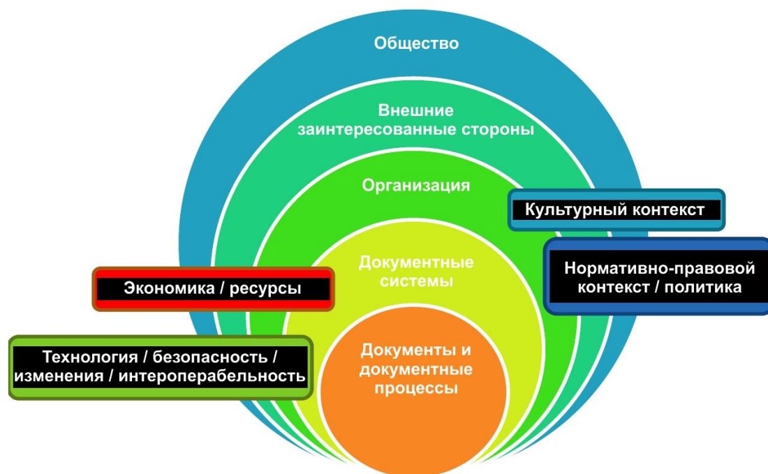
Рисунок 2 — Множественность слоев контекста для документов и документных процессов организации

Различные подразделения организации могут иметь разные точки зрения на неопределенности, связанные с последствиями изменений внешнего контекста (см. рисунок 2). Кроме того, следует иметь в виду, что любые изменения открывают новые возможности, последствия которых могут быть и положительными.